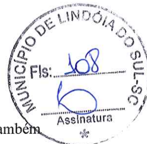
Neimar Cordasso Secretário de Infraestrutura e Transportes