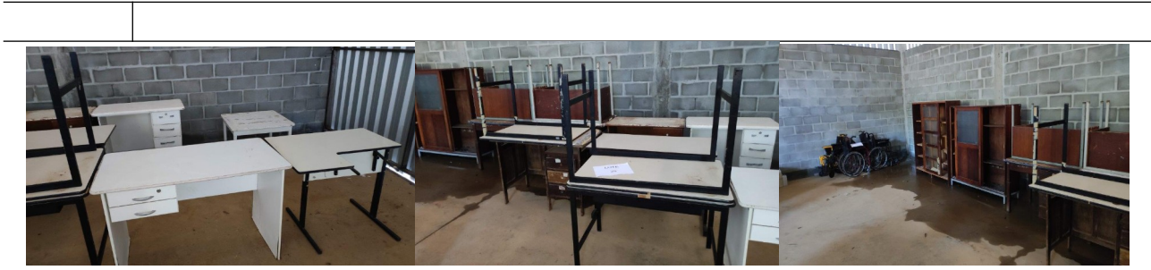
29 | Cadeiras de rodas 5un